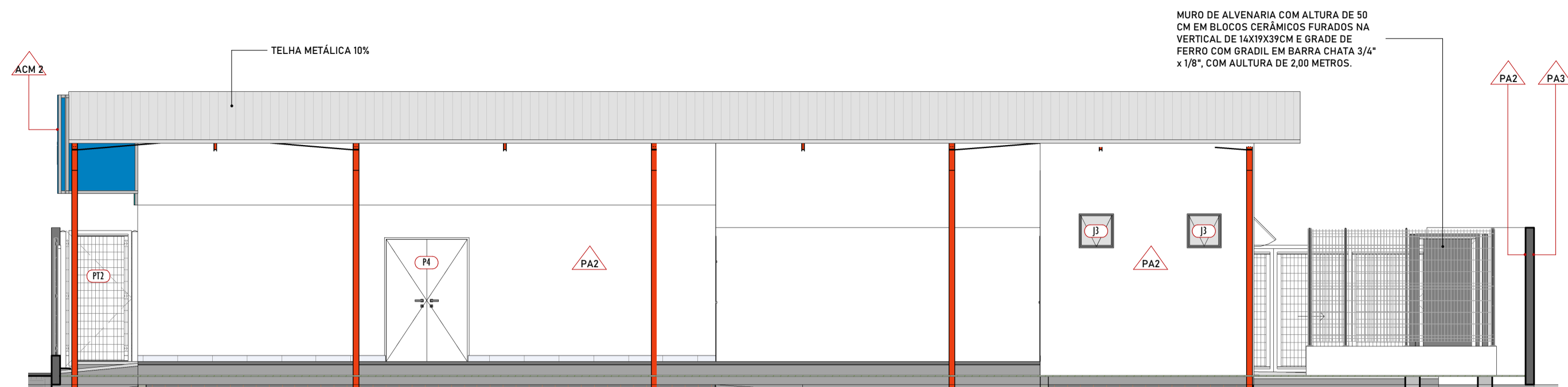
3 FACHADA POSTERIOR 1:75