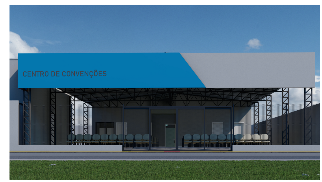
PERSPECTIVAS DA FACHADA 02