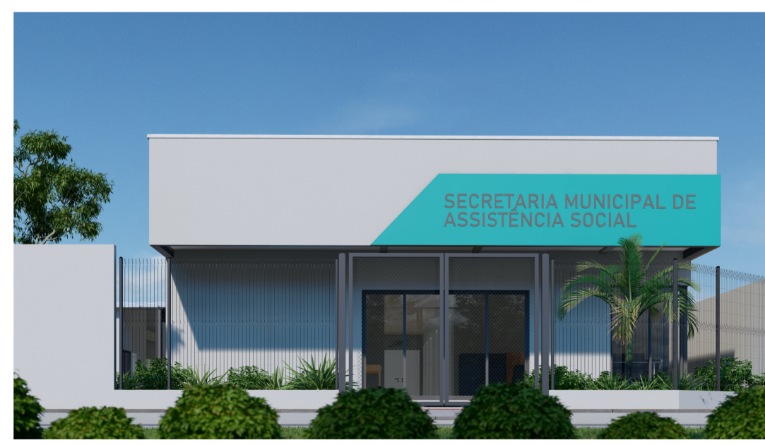
PERSPECTIVAS DA FACHADA 01