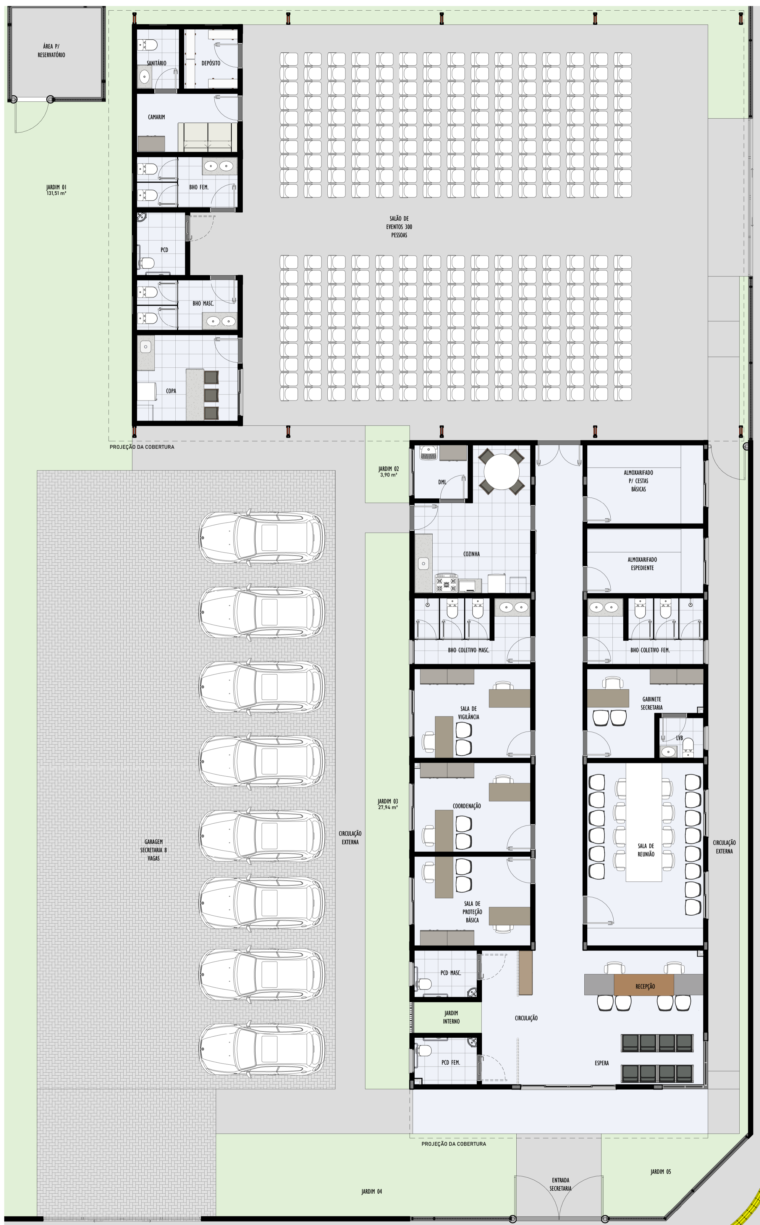
1 PLANTA DE LAYOUT PAVIMENTO TÉRREO 1:75